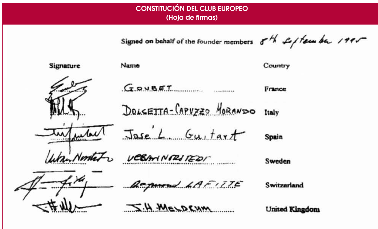
Fig. 1. Firmado en nombre de los miembros fundadores el día 8 de septiembre de 1995.