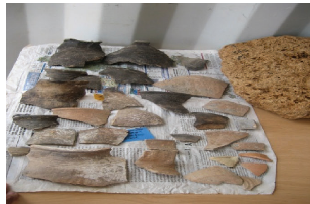
"La Rambla de Rozaleme". restos cerámicos.