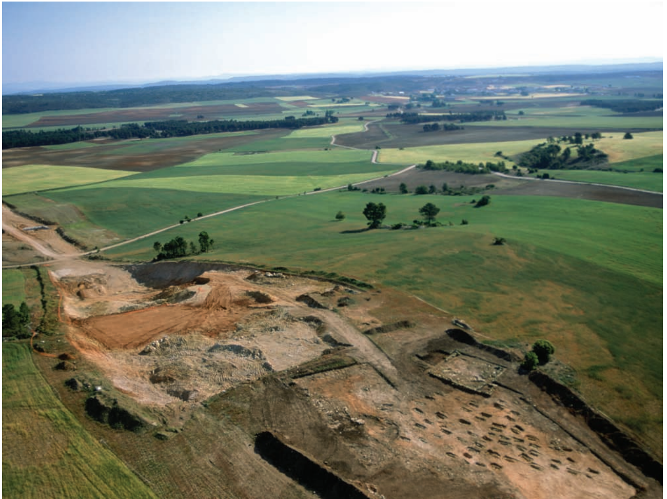
"Los Colmenares". Vista general.

jadadores. Se encontró un lucernario, (pequeña oquedad en la pared para la ubicación de la lucerna o lámpara de minero) in situ, en una de las galerías de la mina excavada.