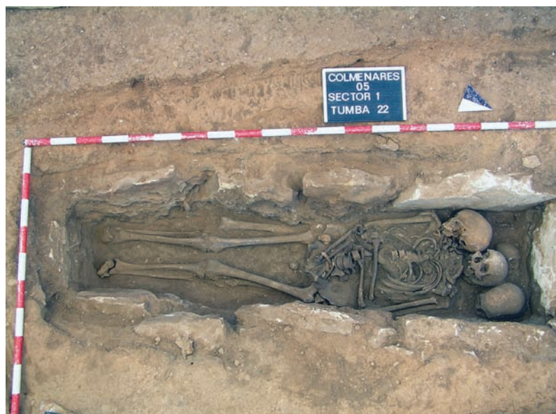
"Los Colmenares". Tumba colectiva.

locidad. Era una necrópolis de época visigoda de la segunda mitad del siglo VI y el siglo VII (12). El complejo funerario quedaría circunscrito a un poblado cercano, desconocido en la actualidad (13).