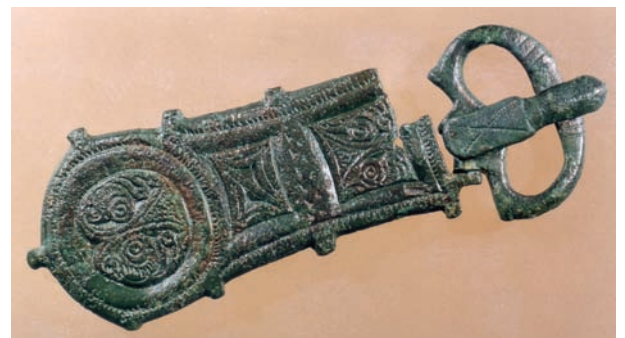
"Los Colmenares". Fibula.

Yacimiento repetidas veces buscado desde los años 60 del siglo pasado y que se encontró durante la construcción de la plataforma de la línea de Alta Ve-