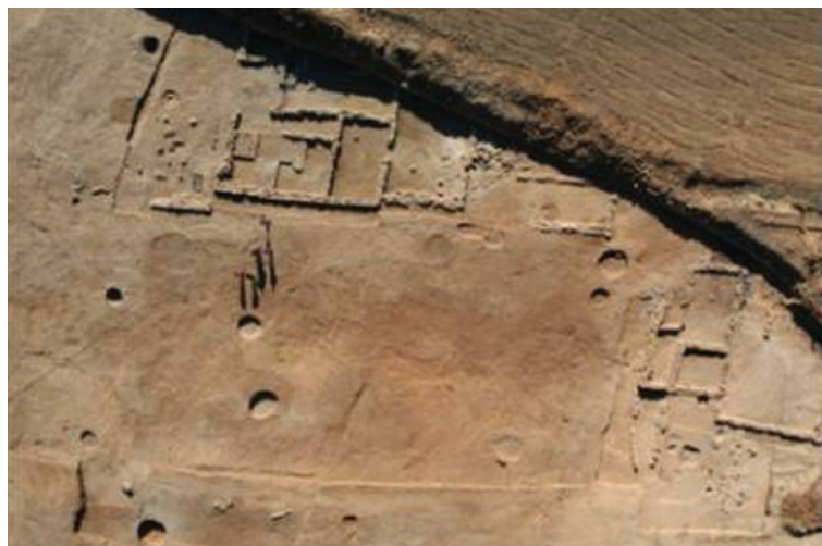
“Los Canónigos”. Vista General.

Se han documentado un total de nueve enterramientos y un gran túmulo, con restos estructurales mayores y más complejos, que albergaba un rico enterramiento. Esta tumba de incineración, de tipo “túmulo o estela”, contenía el ajuar propio de un person-