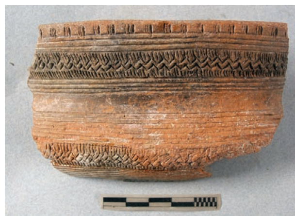
"Alto del Romo". Cerámica campaniforme.

Este extenso yacimiento, ha puesto al descubierto un gran número de estructuras pertenecientes a un poblado de la Edad del Cobre que podría fecharse entre 2500 y 1800 antes de Cristo (4). Este poblado se puede calificar como grande, comparándolo con otros de esta zona de la Meseta. Los restos descubiertos corresponden a épocas que abarcan unos 600 años, lo cual indica que se debieron producir sucesi-