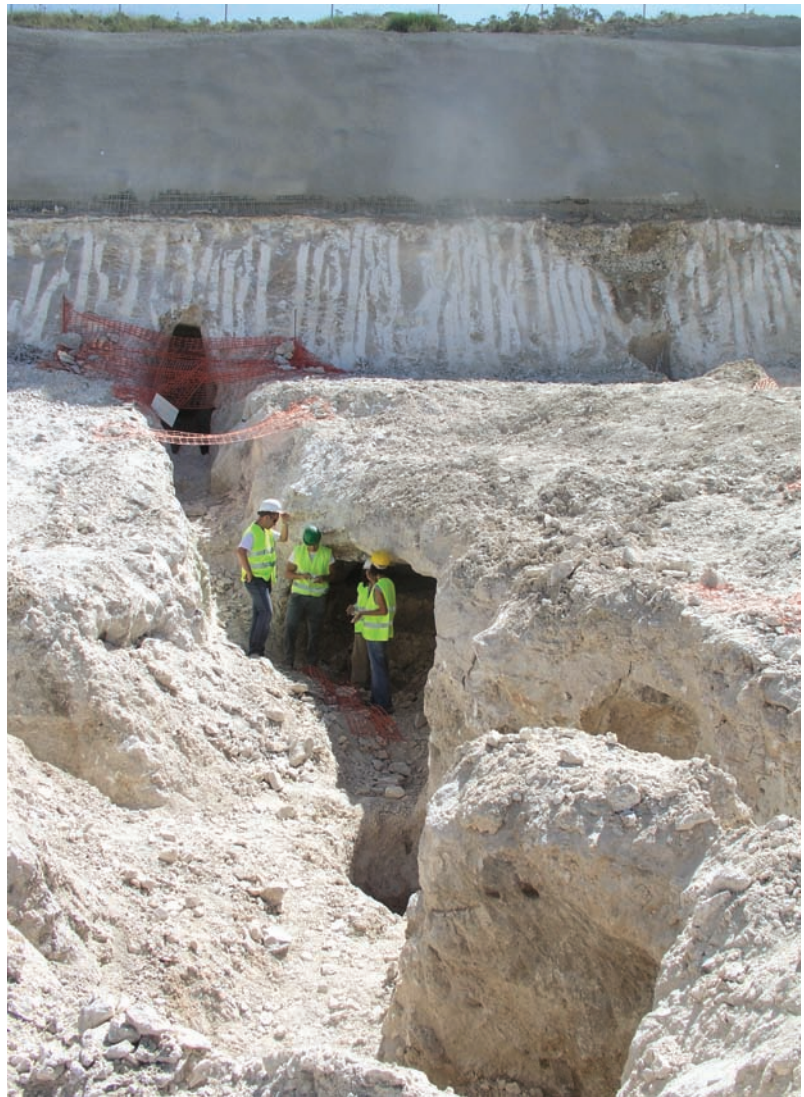
Mina romana de "Lapis Specularis".

Este ha sido un hallazgo muy importante para comprender la evolución económica de la región durante el imperio romano. En un paraje minero por excelencia en la antigüedad, se encontró una mi-