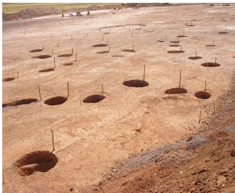
“Alto del Romo”. Vista general.

En otras estancias excavadas se llevarían a cabo trabajos relacionados con la metalurgia, como ponen