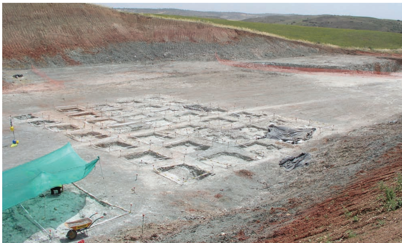
Sondeos paleontológicos valorativos en el yacimiento de "Lo Hueco". Vista general.

se de proyecto o durante el desarrollo de las mismas, se realizan sondeos arqueológicos valorativos. Estos tienen como finalidad la de delimitar y documentar el potencial hallazgo, valorando la afección real de la obra. En algunas ocasiones, en las que el resultado es positivo y el área va a ser afectada definitivamente por la traza, se realiza una excavación en extensión del yacimiento. Los objetivos científicos de una excavación integral son: