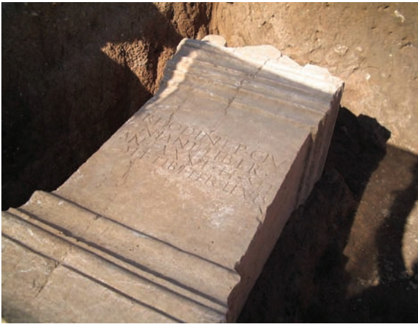
Villa de Cornelius. Estela funeraria de Rhodine.

producción, procesado y almacenaje de los productos agropecuarios ( pars rustica y pars fructuaria ). La parte urbana estaba edificada, alrededor de un patio porticado ( peristilium ) con una piscina que recogía el agua de la lluvia ( impluvium ), tenía termas, jardines y zona religiosa. En esta parte es donde se han encontrado materiales nobles, esculturas y mosaicos. La zona "fructuaria", con estancias de trabajo para la elaboración del lino y el cáñamo, tenía zonas para el almacenamiento, un patio de carga y descarga de mercancías y estancias para los trabajadores (8).