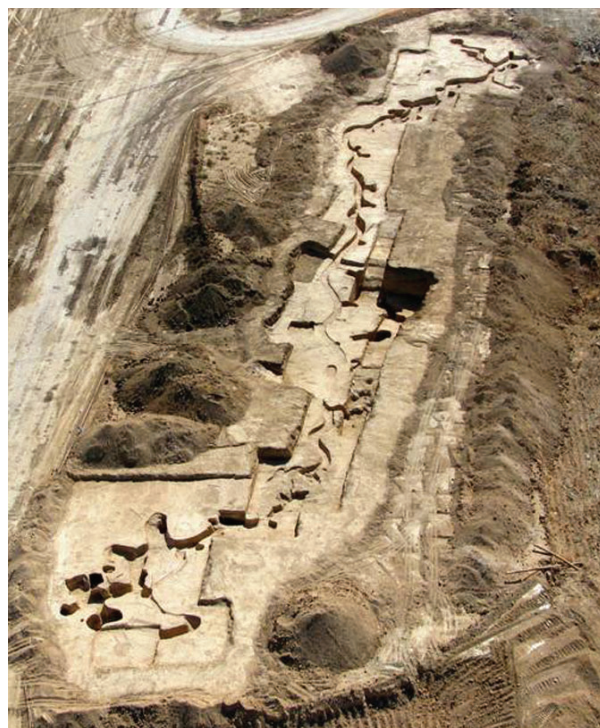
"Dehesa de los Llanos". Trincheras.

En la trinchera de Dehesa de Los Llanos , se excavaron 49 unidades funcionales (abrigos habitacionales, puestos de tirador, cuevas, aljibe y la propia trinchera). Por su situación, tipología y materiales hallados, la trinchera fue construida por los milicianos que defendían a la República en el frente de Seseña, durante la 1ª fase de la Guerra Civil Española