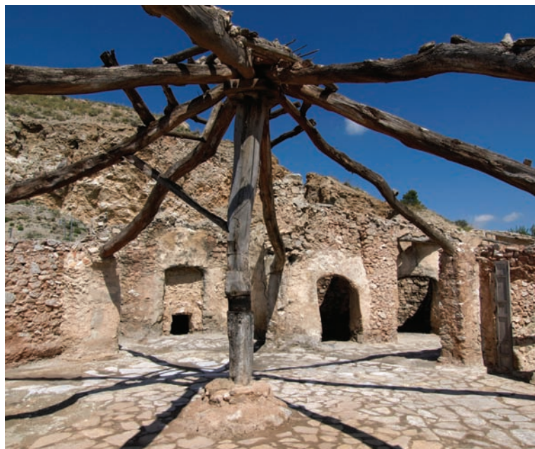
"Yesar de Polovar".

yó y su evolución en el tiempo; el patrimonio socio-económico (21) y cultural generado por el edificio y su influencia en el entorno y en la evolución económica y cultura de la zona (22).