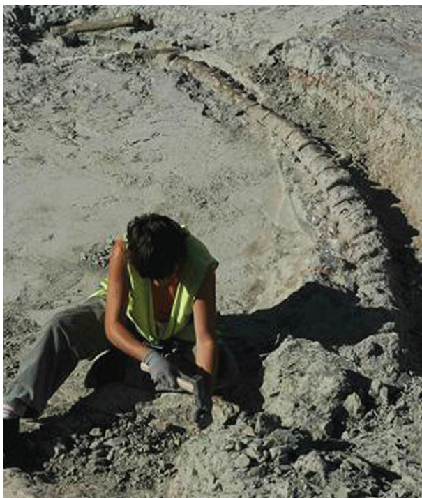
"Lo Hueco". Vértebra cola.

A continuación se destacan los yacimientos de mayor importancia: