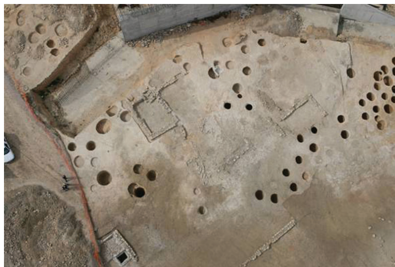
"Corrales de Mocheta". Vista general.

Los elementos más destacados en el interior de los ámbitos son las piletas de forma cuadrangular. Estas construcciones son típicas dentro de las tenerías