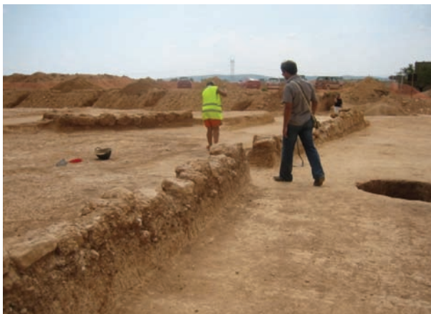
"La Rambla de Rozaleme". Vista general.

Se llevó a cabo una investigación histórica sobre el propio edificio, así como de la familia que lo construyó.