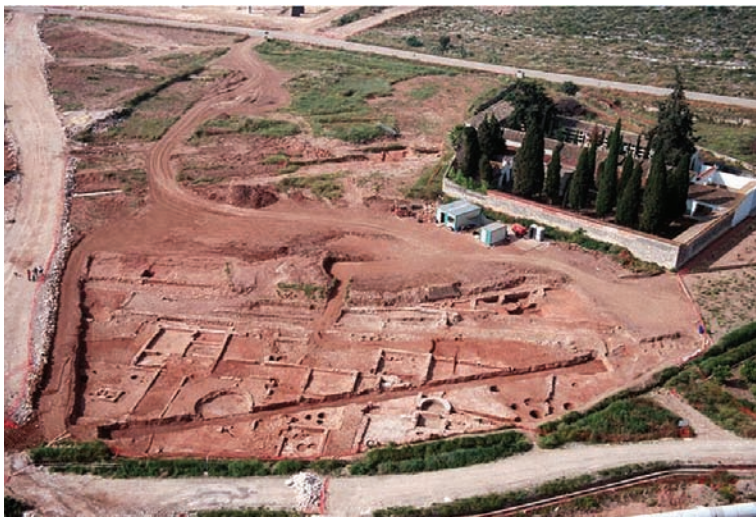
"L'Enova". Vista General.

Esta villa, tenía una zona dedicada a la residencia de los propietarios (pars urbana), y otra destinada a la