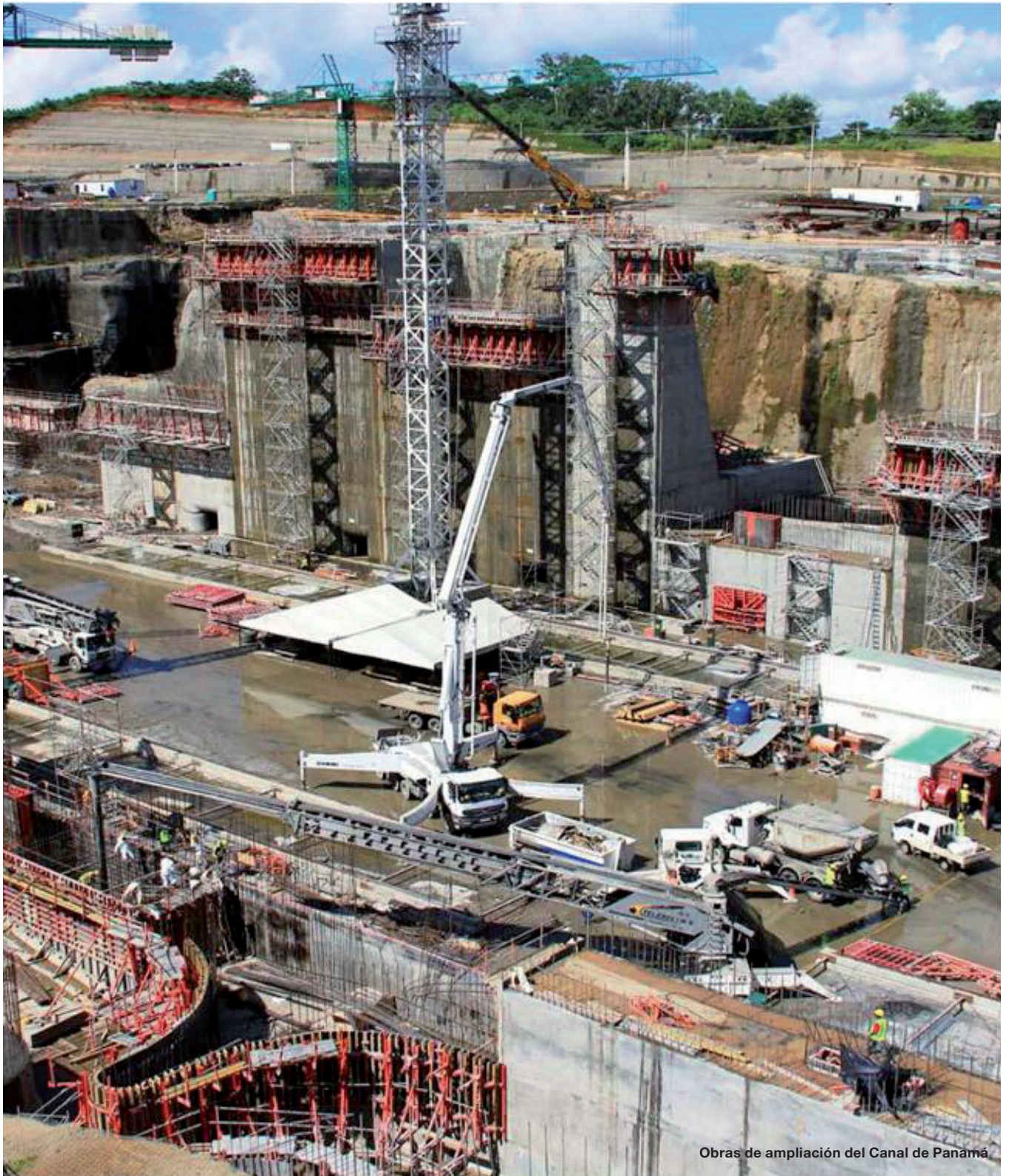
Obras de ampliación del Canal de Panamá