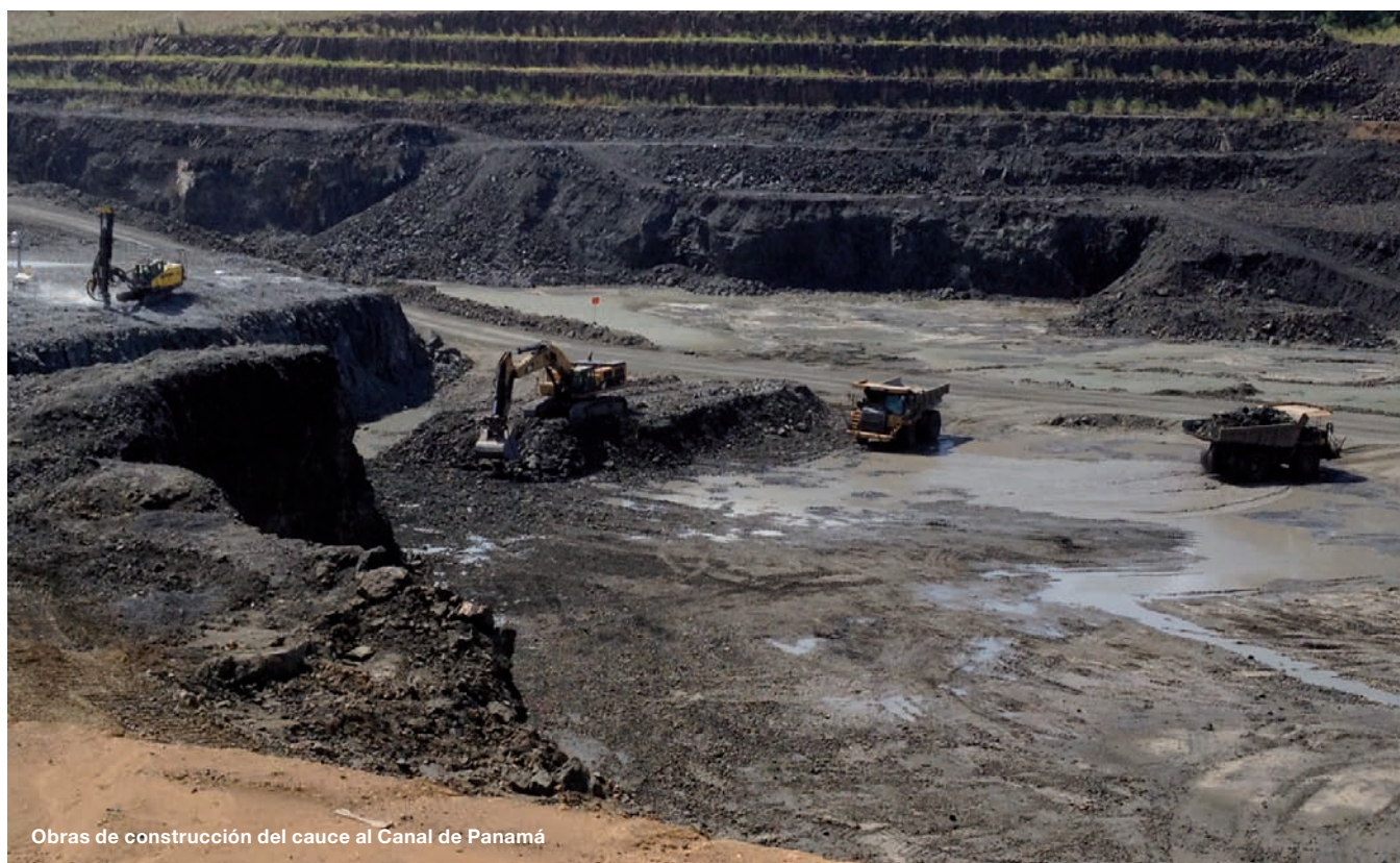
Obras de construcción del cauce al Canal de Panamá

formar parte de equipos técnicos con mucha experiencia en obras complejas en todo el mundo, el alto grado de aprendizaje y disponer de equipos formados por ingenieros de múltiples nacionalidades con formas de trabajo distintas”. Además destaca “la experiencia, a nivel personal pero también familiar, de empezar en un país nuevo con costumbres y formas de vida distintas a las propias”.