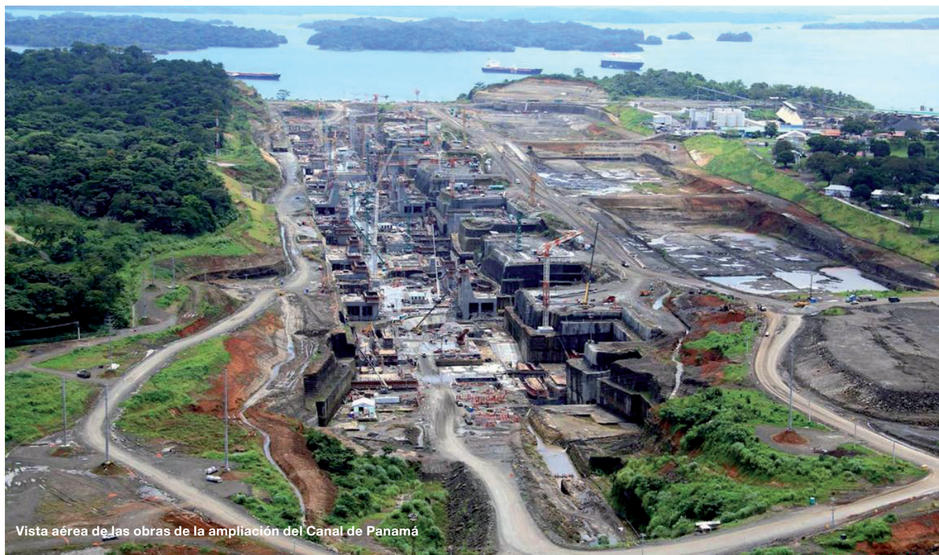
Vista aérea de las obras de la ampliación del Canal de Panamá

El diseño desarrollado para la línea 1 del Metro contempla la construcción de doce estaciones de pasajeros: seis para el tramo subterráneo, cinco para el tramo elevado y se prevé, además, la opción de construir una estación extra.