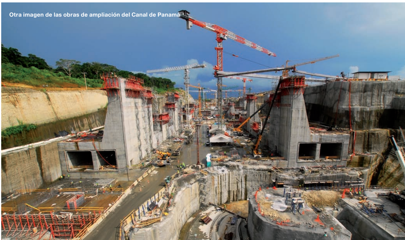
Otra imagen de las obras de ampliación del Canal de Panamá

Asimismo, el Ministerio de Salud del Gobierno de Panamá ha adjudicado a COMSA y a Teyco la construcción de otros tres hospitales de 2.746 m 2 cada uno.