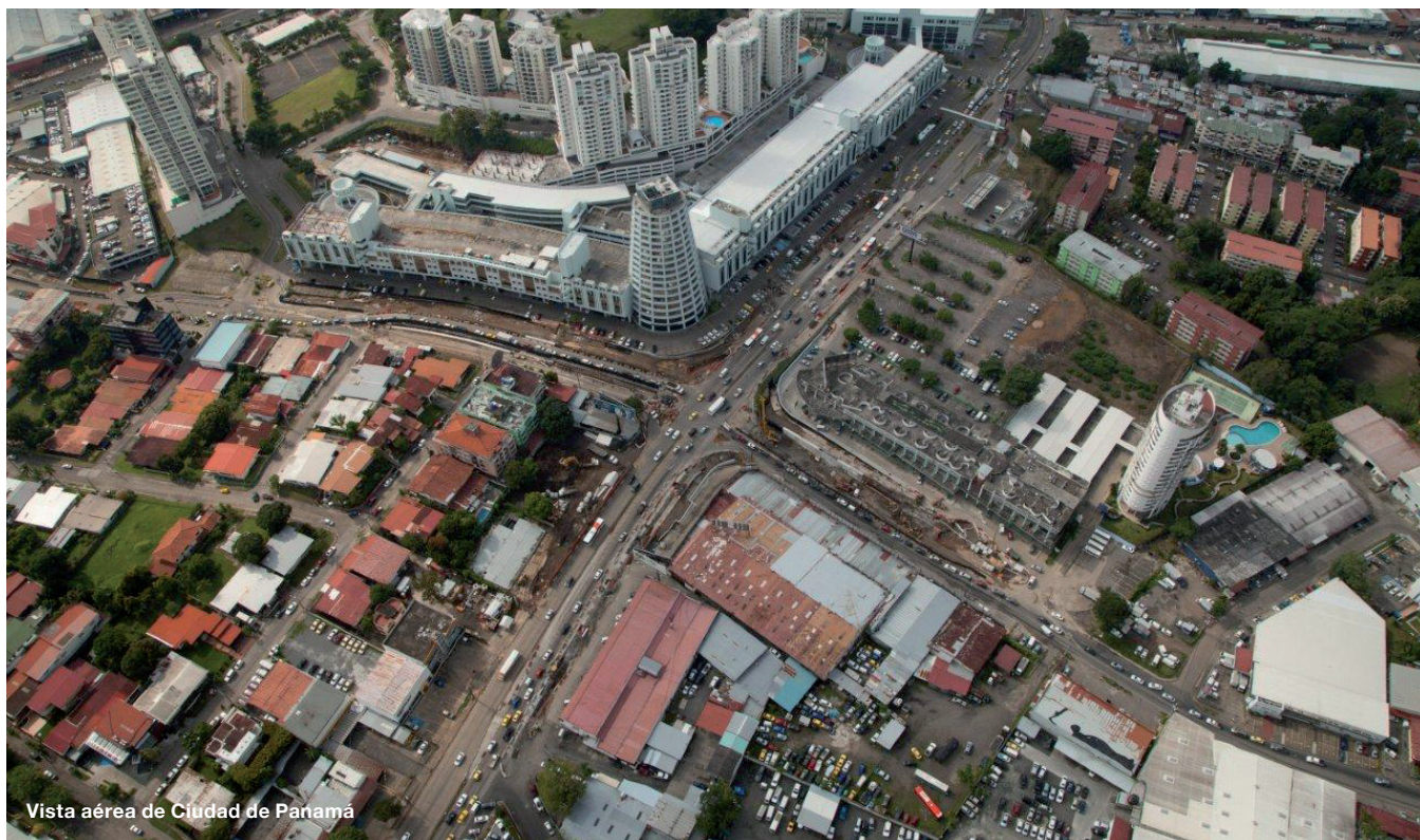
Vista aérea de Ciudad de Panamá

para que el título profesional español sea reconocido en Panamá en términos de reciprocidad. Para ello, cuenta con el respaldo expreso del Gobierno. Asimismo, el Colegio está activando un convenio para posibilitar la inscripción de los ingenieros de Caminos en la Sociedad Panameña de Ingenieros y Arquitectos.