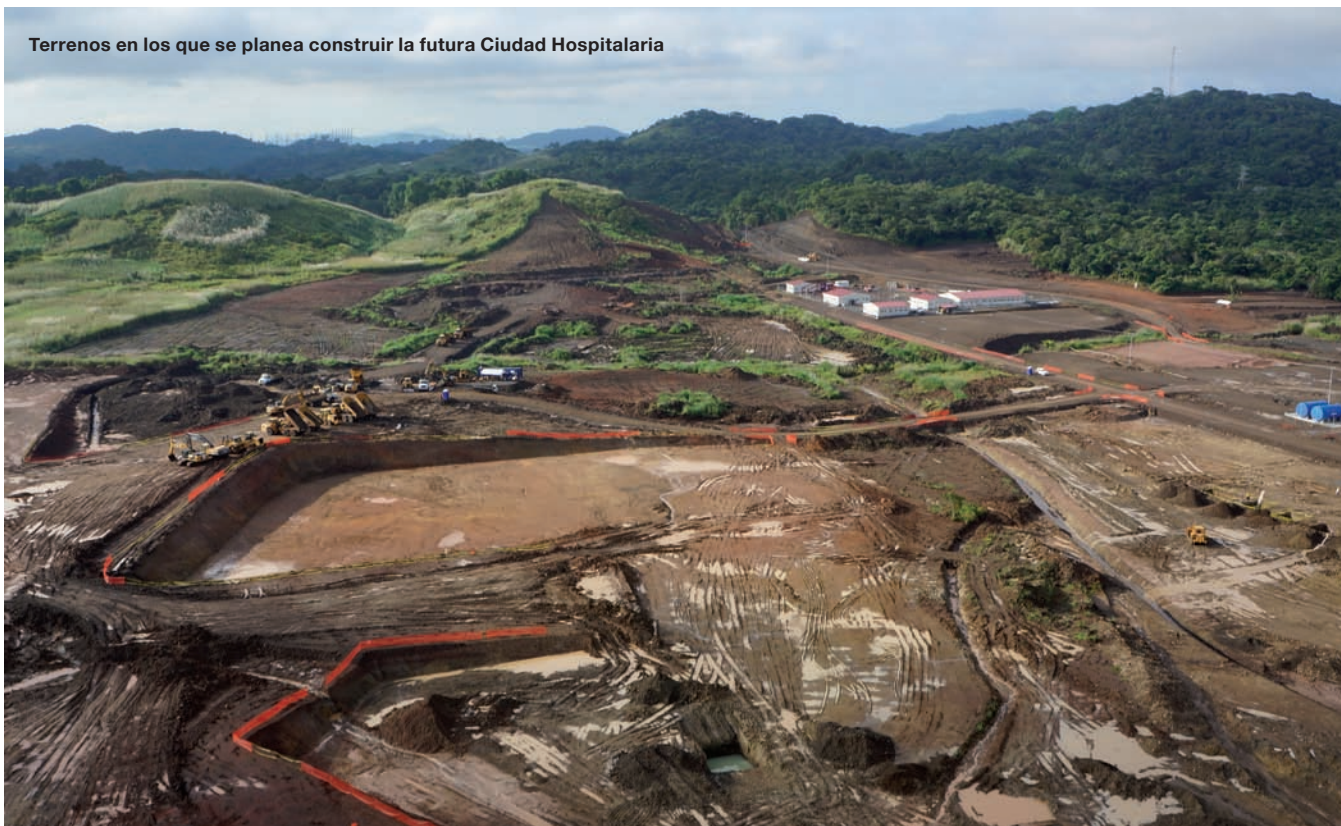
Terrenos en los que se planea construir la futura Ciudad Hospitalaria

los siete días de la semana. En el resto de actividades se trabaja en mayor o menor medida 24 horas al día de lunes a sábado, dejando los domingos para trabajos extra cuando es necesario, y puesta en servicio de reubicación de utilidades. Los ingenieros de Caminos que trabajamos en la construcción de la línea 1 del Metro tenemos puestos de gestión, y solemos hacer entre 12 y 14 horas diarias, de lunes a viernes y 6 o 7 horas los sábados, aunque debido al nivel de exigencia del proyecto difícilmente podemos desconectar”.