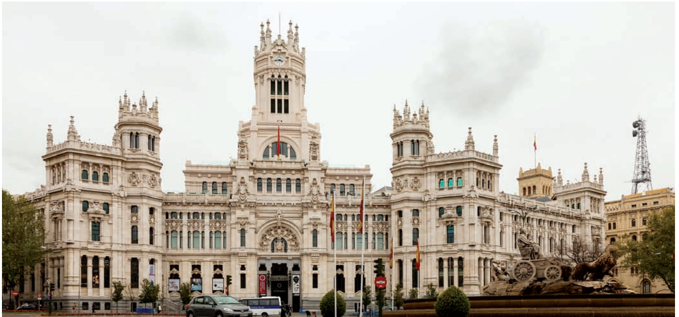
Plaza de Cibeles, Madrid

y universidades, agrupadas en 12 clústers y cinco parques tecnológicos con el objetivo de generar negocio y buscar nuevas oportunidades para las empresas.