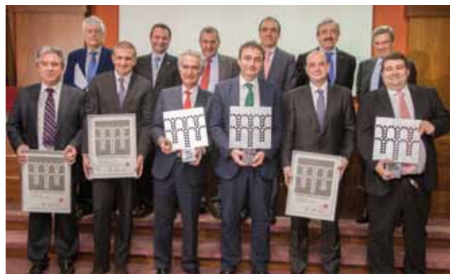
Foto de los premiados