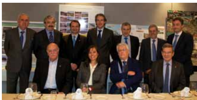
Miembros del Jurado