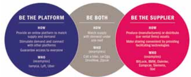
Fig. 6. Los tres formas de respuesta para acceder a las plataformas digitales según Roland Berger Consultores