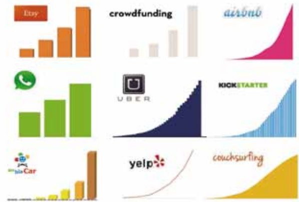
Fig. 5. Distintos tipos de Plataformas Digitales y su evolución