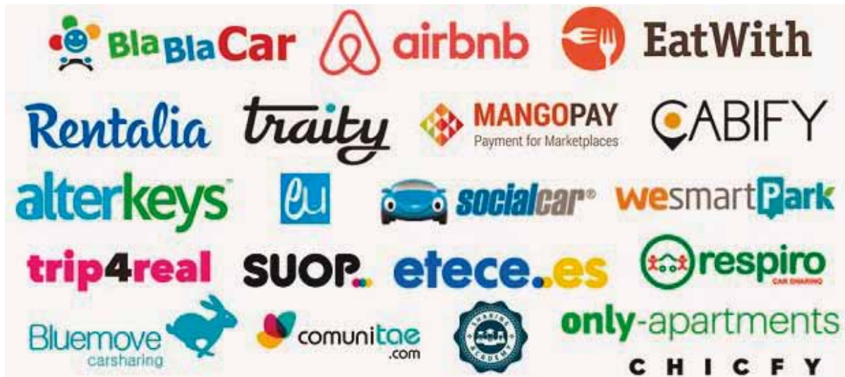
Fig. 4. Nuevas marcas emergentes en la Movilidad compartida y colaborativa

c. El sector de la movilidad es un campo de pruebas para las soluciones de software y hardware del mañana.